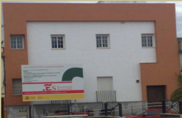
Centro de día Plaza de la Feria

El alcalde de Niebla atenta contra la inteligencia de los nioplenses al querer inaugurar dos días antes de las próximas elecciones de 2011 unos edificios públicos cuyas obras llevan finalizadas año y medio